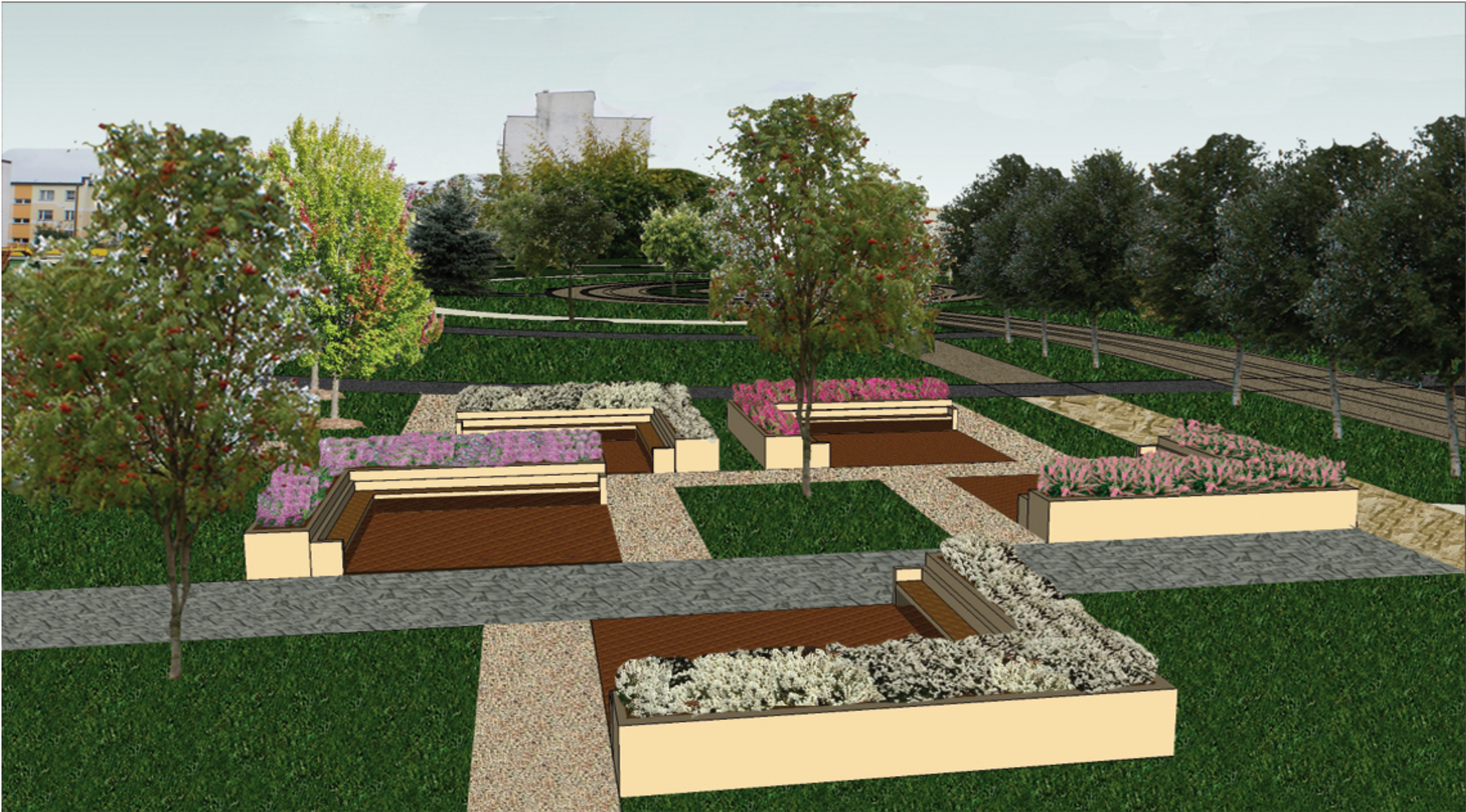
Widok na siedziska